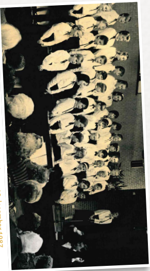
Kindkerkoor 'de Sangheertjes' trad op in De Aker op 19 december 1987

Putten was in die jaren sterk aan het groeien. De nieuwe A28 maakte het dorp bereikbaar voor nieuwkomers, en de lokale gemeenschap bloeide. Vergaderingen, catechisaties en jeugdbijeenkomsten vonden plaats op verschillende plekken door het dorp - in consistoriekamers, schoollokalen en natuurlijk in Rehoboth. Het was behelpen en zo ontstond de gezamenlijke droom voor een eigen centrum.