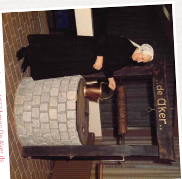
Op 24 oktober 1977 kreeg De Aker de decoratieve naamput cadeau.

Nu, vijftig jaar later, is De Aker uitgegroeid tot veel meer dan een kerkelijk centrum. Op deze centrale plek aan het Fontanusplein komen mensen samen voor de meest uiteenlopende gelegenheden: van zakelijke congressen tot bruiloften, van taalklassen tot feesten. De tijden zijn veranderd, maar één ding blijft hetzelfde: De Aker is nog steeds een plek van ontmoeting, waar gastvrijheid én persoonlijke aandacht voorop staan. Zo staat De Aker al een halve eeuw als een bak in het centrum van Putten - een gebouw dat mensen samenbrengt en waar herinneringen worden gemaakt.